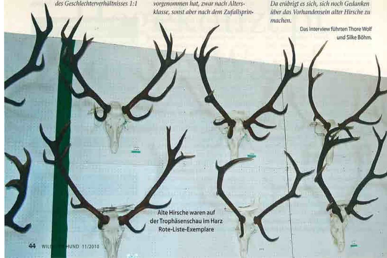
Alte Hirsche waren auf der Trophäenschau im Harz Rote-Liste-Exemplare